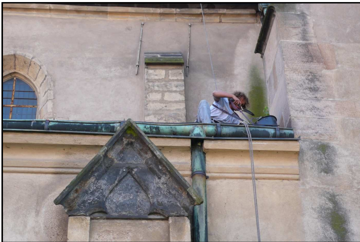
Čištění zanesených okapů kostela sv. Gotharda ve Slaném (2009).